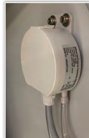
Überwachung Filterzustand über Filter-Differenzdruck